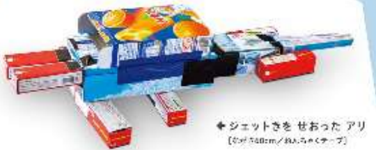
✦ ジェットきをせおったアリ 【長さ740cm/4人用テープ】