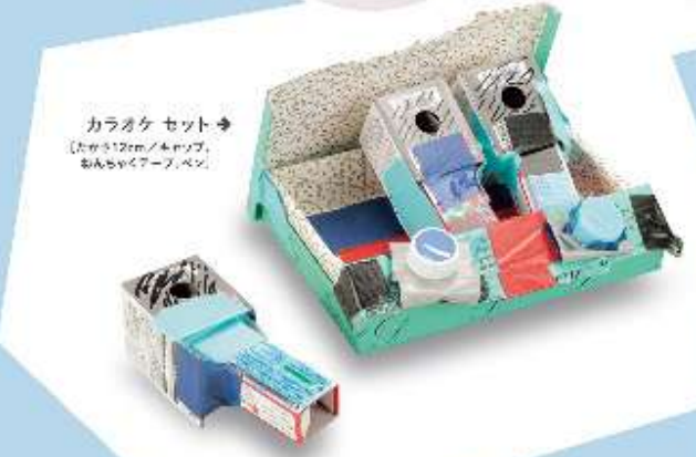
カラオケセット 【長さ120cm/4人用テープ、おんちやくテープ、ペシ】