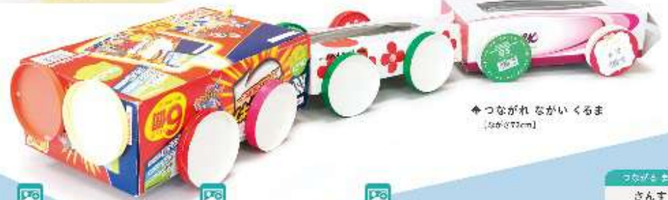
✦ つながれながいくるま 【長さ270cm】