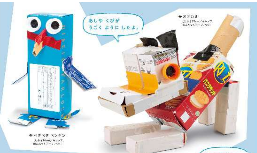
✦ ベタベタペンギン 【長さ140cm/4人用テープ、おんちやくテープ、ペシ】